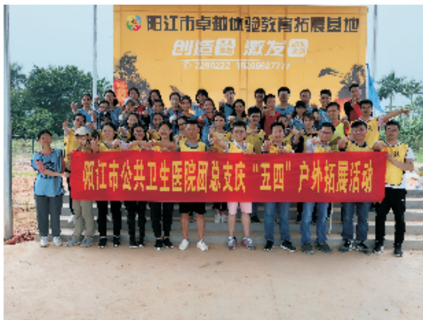
▲ 我院“五四”户外拓展活动合影

青年职工们纷纷表示，经过这次拓展训练，在今后工作中要更加注重提高效率、增进沟通协调和提高执行力，为医院的创新发展增光添彩。（办公室 徐蔓丹）