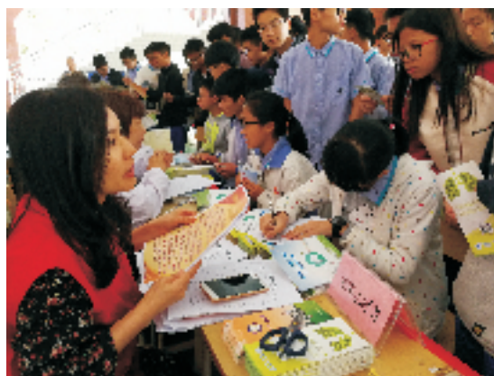
▲ “世界防治结核病日”义诊宣教活动现场