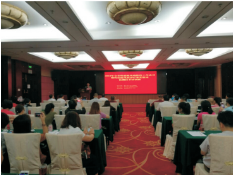
▲2018年性病麻风病防治工作会议暨专业技术培训班现场