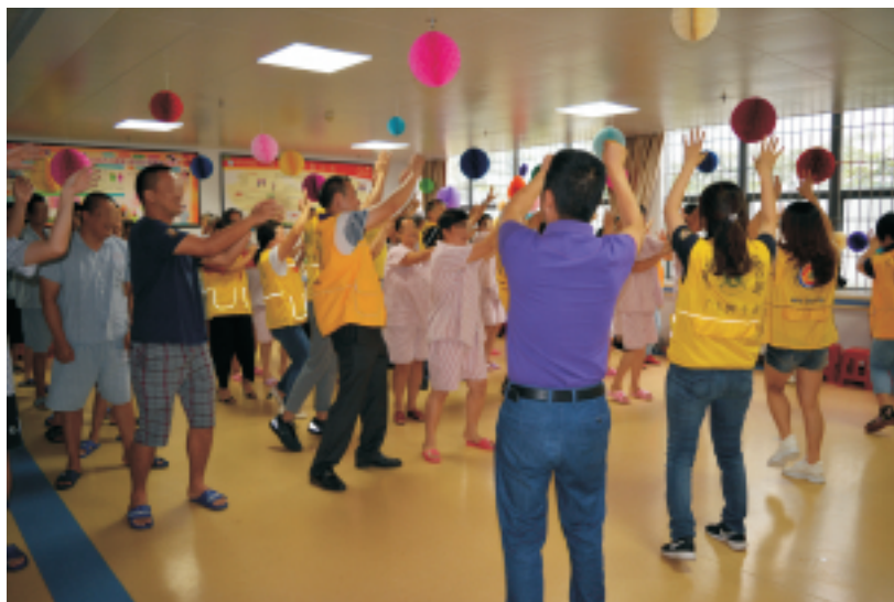
▲ 志愿者与患者举行文娱活动

与会志愿者和住院精神病患者一起合唱《感恩的心》，激发他们对生命的热爱。会后，志愿者还到我院宁心楼和患者举行文娱活动。（办公室钟健敏）