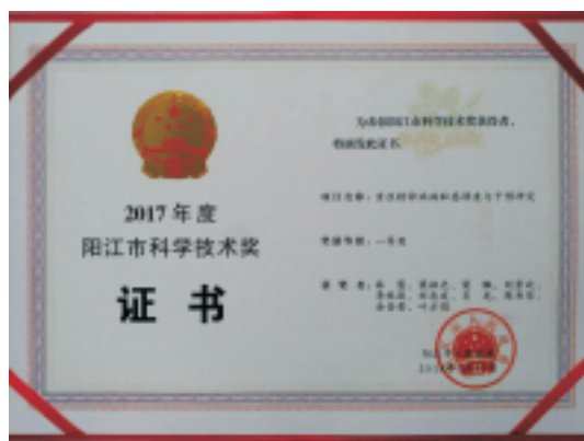
▲ 荣获2017年度阳江市科学技术奖一等奖

分会主任委员单位, 加挂市复退军人医院、市法医精神病司法鉴定所、市精神病防治中心等牌子。目前精神科设有2个男病区、1个女病区、1个老年病区、1个复退军人病区、1个康复科以及3个室外活动区和4个室内活动区, 配置有先进的医疗仪器和科研设备, 如脑电地形图、经颅多普勒、心理CT系统、多导睡眠检查仪、无抽搐电休克仪、遥控和便携式心电监护仪、经颅磁治疗仪、生物反馈治疗系统、电针治疗仪等。(精神一科 黄登强)