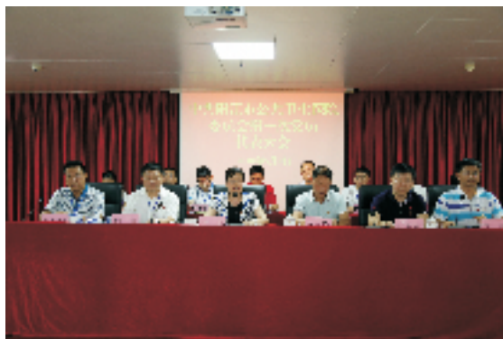
▲市卫生计生局党委书记、党组书记、局长柯燕讲话