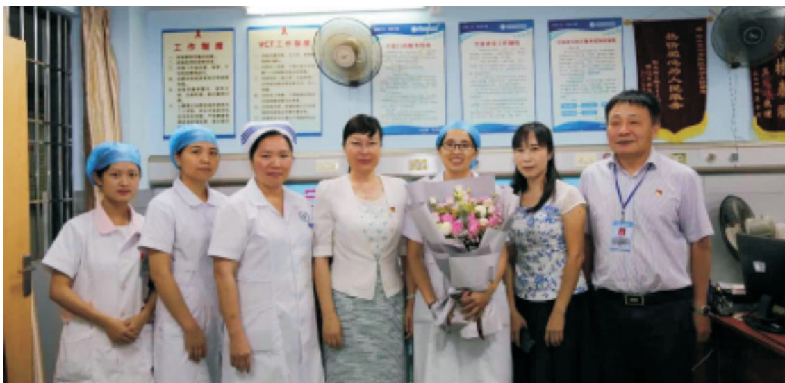
▲柯燕局长和我院护理人员合影

5月11日下午，在第107个国际护士节来临前夕，市卫生计生局局长柯燕、医政科科长梁飞燕等一行到我院看望慰问一线护理人员。我院党委书记、院长傅卓陪同慰问。