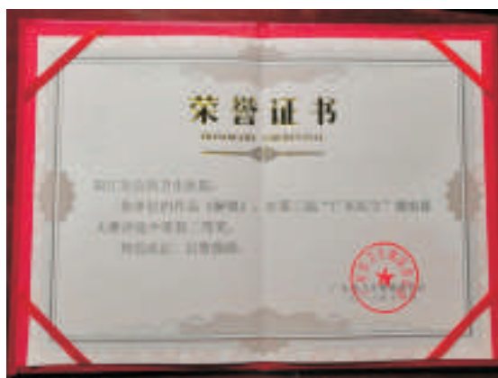
▲微电影大赛二等奖证书

广东省卫生健康系统第三届“广东医生”微电影大赛颁奖大会于12月28日晚19:30分在广州市珠海会堂隆重举行。大会由广东省委宣传部、广东省文明办、广东省直机关工委指导，广东省卫生健康委员会主办，广东省卫生系统思想政治工作研究会、人之初杂志社、广东卫生在线承办。出席颁奖大会的领导有广东省委宣传部副部长蒋斌，广东省卫生健康委党组书记、主任段宇飞及在家的委班子成员。