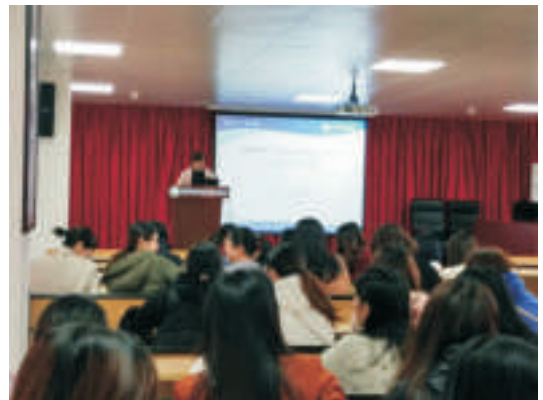
▲梅毒防治工作会议

通过此次会议，加强了各医疗诊疗单位的沟通协作，为今后更好地开展江城区综合防治示范区工作奠定了良好的基础，对带动全市性病防治工作起到了促进作用。（公共卫生科 许小娟）