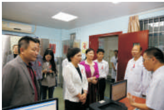
▲慰问抗艾一线医护人员