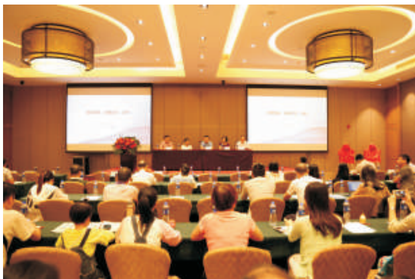
▲ 感染病分会第四届学术年会会议现场

2018年10月27日，阳江市医学会感染病分会第四届学术年会暨第一届阳江市感染论坛成功召开。会议举行了“全国脂肪肝规范诊疗中心”和“中国慢性病乙型肝炎临床治愈（珠峰）工程项目分中心医院”的揭牌仪式，标志着这两项国家级肝病诊疗项目正式落户我院。