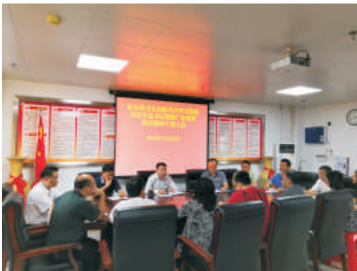
▲ 学习贯彻习近平总书记视察广东重要讲话精神会议

话精神为统领，进一步优化完善发展思路和工作举措，狠抓各项工作落实，认真做好第四季度工作，努力完成年度目标任务，精心谋划明年工作，以扎扎实实的工作成果体现和检验学习贯彻的实际成效，以更坚定的信心，努力工作，切实扛起沉甸甸的历史责任，以强烈的政治担当、扎实努力的工作，为医院发展共谋划，同奋进，进一步优化完善发展思路举措，推进医院重点工作逐步落实。（办公室 梁 飘）