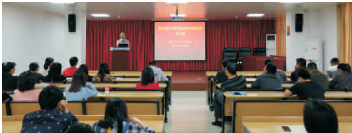
▲ 全市艾滋病诊疗新进展学习班

为进一步加强我市艾滋病防治管理水平，提高艾滋病防治队伍专业水平，推动艾滋病防治工作深入开展，我院于2018年11月29日举办了阳江市艾滋病诊疗新进展学习班。