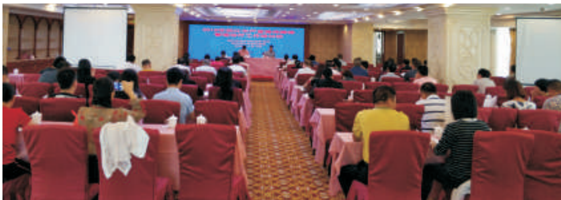
▲ 全市严重精神障碍工作培训班

通过本次培训，使各级精防人员及时了解国家新版工作规范内容，为今后开展严重精神障碍管理治疗工作奠定了良好基础。（公共卫生科 黄楠）