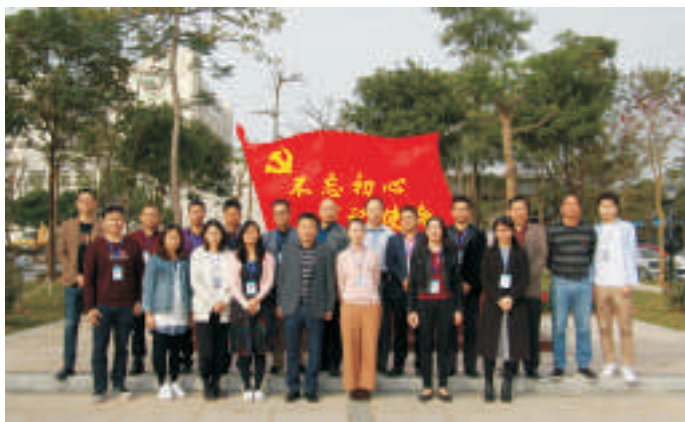
▲ “不忘初心，牢记使命” 党日活动

为深入贯彻落实习近平新时代中国特色社会主义思想 and 党的十九大精神，认真学习贯彻习近平总书记视察广东重要讲话精神，推进“两学一做”学习教育常态化制度化，我院党委组织开展以“不忘初心，牢记使命”为主题的党日活动。