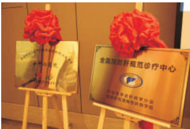
▲ “全国脂肪肝规范诊疗中心”和“中国慢性病乙型肝炎临床治愈（珠峰）工程项目分中心医院”揭牌仪式