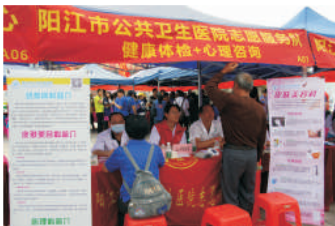
▲ 国际志愿者日活动现场

团委开展以“健康体检、心理咨询”为主题的义诊服务。在义诊区，我院的医疗人员为前来咨询的市民测量血压，根据测量结果，细致地指导他们调整饮食习惯，并解答市民对皮肤性病和心理健康的疑问，同时还发放皮肤性病、心理健康等宣传小册子，提醒广大群众坚持健康的生活方式，身体出现异常要及时就医，医护人员的优质服务深受广大群众的欢迎。